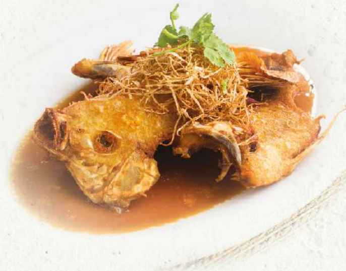
油炸金鳳魚 FD229 Deep Fried Tilapia (一份) RM 45